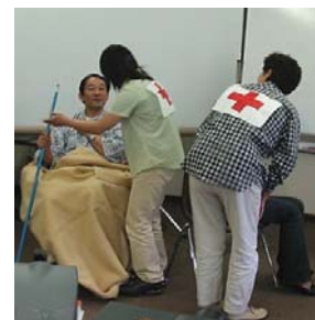
Des participants à l'atelier de formation des formateurs dans un jeu de rôle.

Cette formation a donné le coup d'envoi à la mise, sein de la Croix-Rouge japonaise, d'un nouveau programme axé sur l'intégration du soutien psychologique dans différents types d'opérations de secours. Il est prévu de former 120 formateurs au cours des deux prochaines années, de manière à couvrir 47 sections et 91 hôpitaux de la Croix-Rouge à travers le pays. Ces formateurs seront ensuite chargés de former les membres des équipes de secours médicaux et les volontaires de la Société japonaise, dans leurs propres locaux, tandis que certains d'entre eux participeront aux opérations internationales de secours. En outre, un groupe de travail sera créé pour donner davantage d'orientations au sujet de l'intégration du soutien psychologique dans les opérations de secours en cas de catastrophe, aux échelons national et international, et pour adapter le manuel de formation à la culture et au contexte japonais. ■