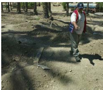
Chaque jour, des volontaires du Croissant-Rouge ont la lourde tâche de ramasser les corps et de les inhumer.

Récemment, une équipe d'évaluation intersectorielle et multinationale de la Fédération internationale des Sociétés de la Croix-Rouge et du Croissant-Rouge s'est rendue en Iraq, un pays ravagé par la guerre. L'équipe est parvenue – malgré de sérieux problèmes de sécurité – à visiter 16 sections sur 18. Si une chose est désormais claire, c'est que les volontaires du Croissant-Rouge de l'Iraq représentent une ressource inestimable pour les opérations de secours dans tout le pays.