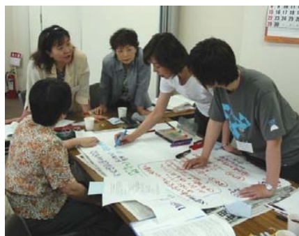
Travail en groupe.