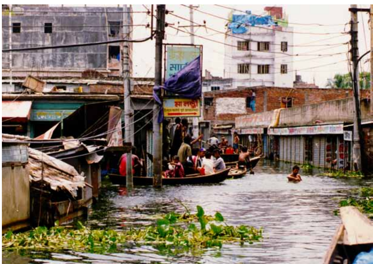
Víctimas de la inundación rescatadas y transportadas en barca por las calles principales, Bangladesh.

Existen tres áreas de preocupación creciente en lo referente al cambio climático y su relación con la salud mental. En primer lugar, es muy probable que los impactos directos del cambio climático, como los fenómenos climáticos extremos, tengan consecuencias inmediatas en la salud mental. En segundo lugar, la población vulnerable empieza a experimentar trastornos en los factores sociales, económicos y ambientales que favorecen la salud mental. Por último, cada vez se comprenden más las maneras en que el cambio climático, en tanto que supone una amenaza medioambiental global, puede crear ansiedad sobre el futuro.