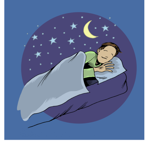
پشودان له بیر مه که