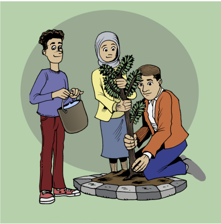
به شدار ببه له چالاکیه کۆمه لایه تی و خزانیه کان