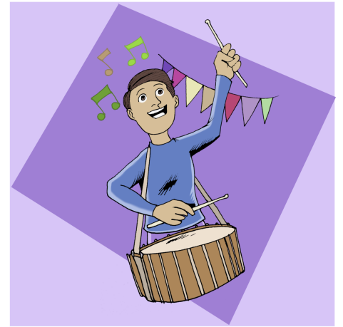
کانتکی خۆش به سه ر به ره له پۆنه کاند