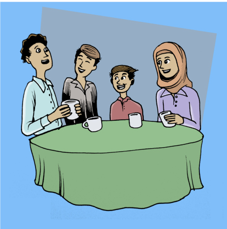
کات به سه ر به ره له گه ل ئه و که سانه ی خۆشت ده وین