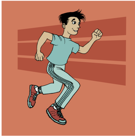
وه رزشی به رده وام ئه نجام بده