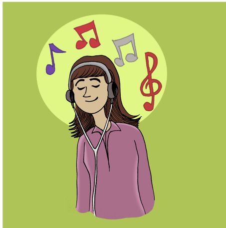
گوئ بگره له و گزانی و موسیقایانه ی حه زیان پنده که یت