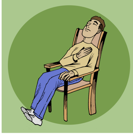
ته کنیکی ئارامبونه وه و همنبونه وه به کاربهته