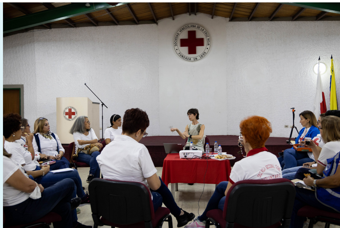
Reunión con el equipo de voluntarios SMAPS de la Cruz Roja Venezolana en Táchira