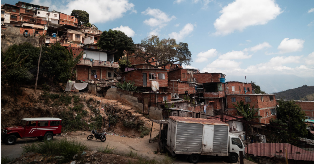
Las Mayas, una comunidad ubicada en los suburbios de Caracas, Venezuela

Las Mayas es un barrio ubicado en los suburbios de Caracas, con infraestructura y acceso a servicios muy limitados. La comunidad incluye alrededor de 3500 familias, con un total de aproximadamente 9000 personas, que viven en entornos de bajo ingreso y acceso limitado a gas y agua potable. HIAS (Hebrew Immigrant Aid Society) , estado proporcionando actividades centradas en SMAPS y agua, saneamiento e higiene (WASH) en Las Mayas, sirviendo a alrededor de 3000 miembros de la comunidad desde el comienzo de la pandemia de COVID-19. Tuvimos la oportunidad de visitar uno de sus proyectos, en el que han capacitado a miembros de la comunidad para dar talleres desde un enfoque en salud mental y bienestar psicosocial, a través de herramientas como Hacer lo que importa en tiempos de estrés de la OMS.