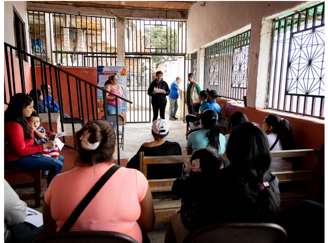
Taller comunitario sobre manejo del estrés en Las Mayas, apoyado por HIAS

Este taller se centró en el manejo del estrés en el que los facilitadores, miembros de la propia comunidad, demostraron herramientas de afrontamiento como ejercicios de respiración para ayudar a los miembros de la comunidad a enfrentar sus desafíos diarios. Como comentaba uno de los facilitadores, estos talleres no solo tienen como objetivo apoyar las necesidades psicosociales, sino también conectar a los miembros de la comunidad entre sí para que no se sientan solos en sus pensamientos y preocupaciones diarias.